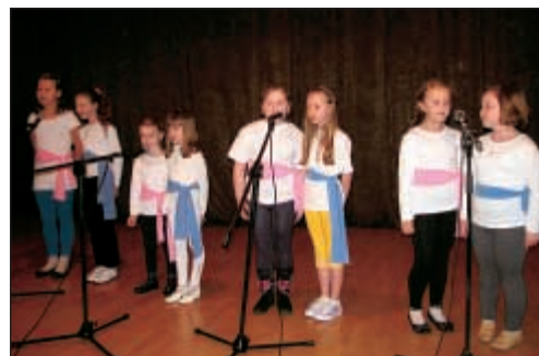
Zespół wokalny „Świąteko” z MOK w Czerwionce-Leszczynach