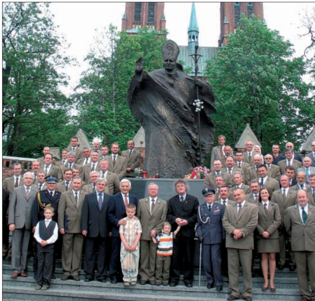
RYBNIK, 18 maja 2008 r. – uroczystość przed bazyliką p.w. św. Antoniego z udziałem m.in. posłów, senatorów, przedstawicieli władz samorządowych oraz Jerzego Buzka, obecnie przewodniczącego Parlamentu Europejskiego; Dąb Jana Pawła II to jedno z drzewek wyhodowanych z żołądzi najstarszego w naszym kraju Dębu „Chrobry”, które Ojciec Święty pobłogosławił podczas pielgrzymki polskich leśników do Watykanu w kwietniu 2004 r.