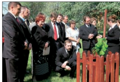
LESZCZYNY, 18 maja 2006 r. – pamiątkowa fotografia z uroczystego posadzenia Wadowickiego Dębu Pamięci Ojca Świętego Jana Pawła II przed budynkiem Zespołu Szkół nr 1