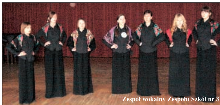
Zespół wokalny Zespołu Szkół nr 3