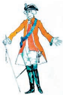
Żupnik polski z końca XVIII wieku

Współcześnie w użyciu są dwa rodzaje mundurów – służbowy i uroczysty. Mundury służbowe są używane wyłącznie przez pracowników dozoru i nadzoru górniczego wyższych szczebli. Obecnie w kopalniach i różnego rodzaju instytucjach górniczych spotyka się je coraz rzadziej. Mundury uroczyste, czyli galowe, noszone są w czasie różnych uroczystości i świąt. W dalszej części artykułu zajmować się będziemy tylko tym rodzajem mundurów. W wieku XVIII na ziemiach Polskich nie opisano żadnych elementów stroju, które by mogły wyróżniać górników spośród innych urzędników. Znana jest rycina, przedstawiająca żupnika, czyli zarządcę kopalni soli. Ubrany jest w strój przypominający mundur oficerski z tego czasu. Dopiero z chwilą powołania Królewskiego Korpusu Górniczego w 1817 r. określono zasady ubioru dla urzędników korpusu różnych szczebli.