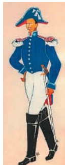
Mundur inżyniera górniczego – 1830 r.