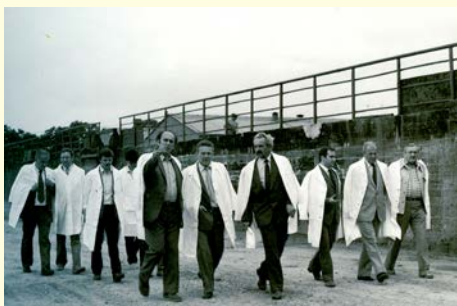
Wizyta władz wojewódzkich w Kombinacie PGR