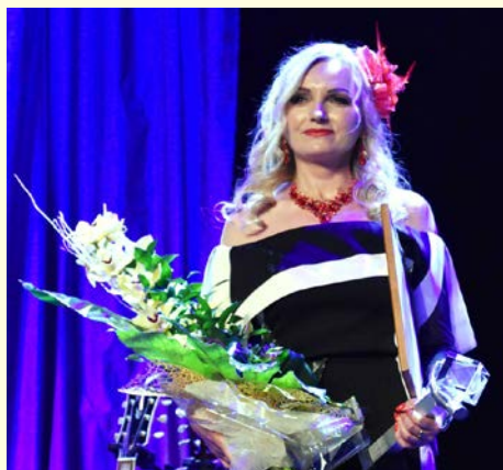
Silesia Meble Sp. z o.o.