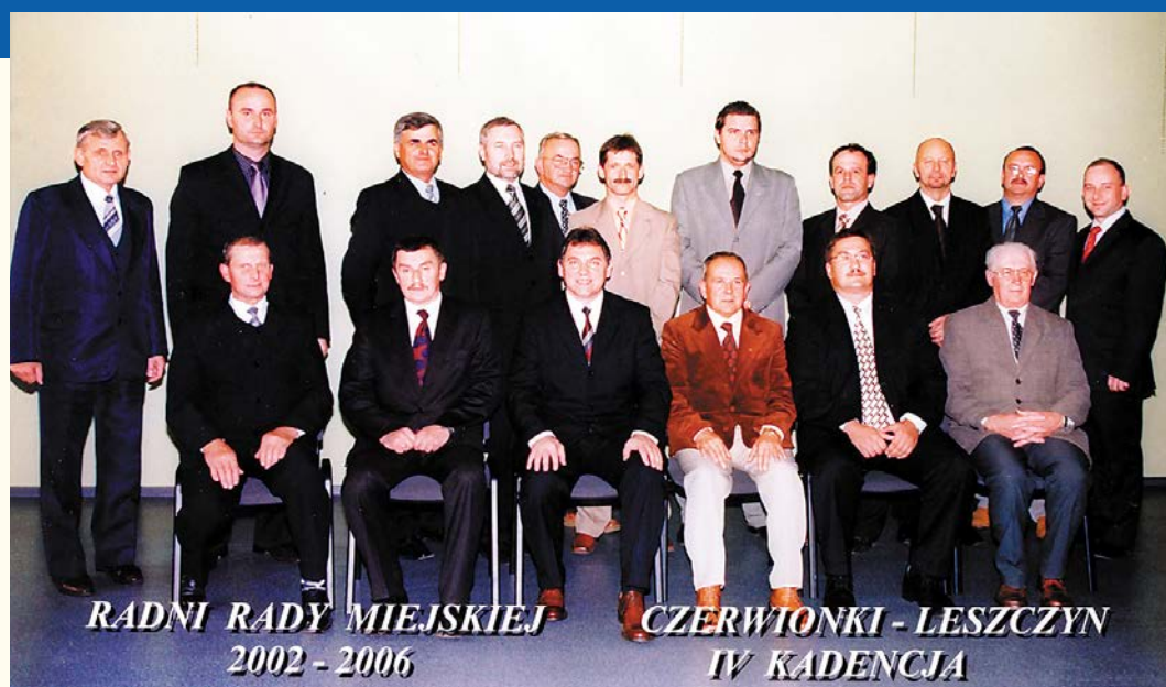
RADNI RADY MIEJSKIEJ 2002 - 2006 CZERWIONKI - LESZCZYN IV KADENCJA