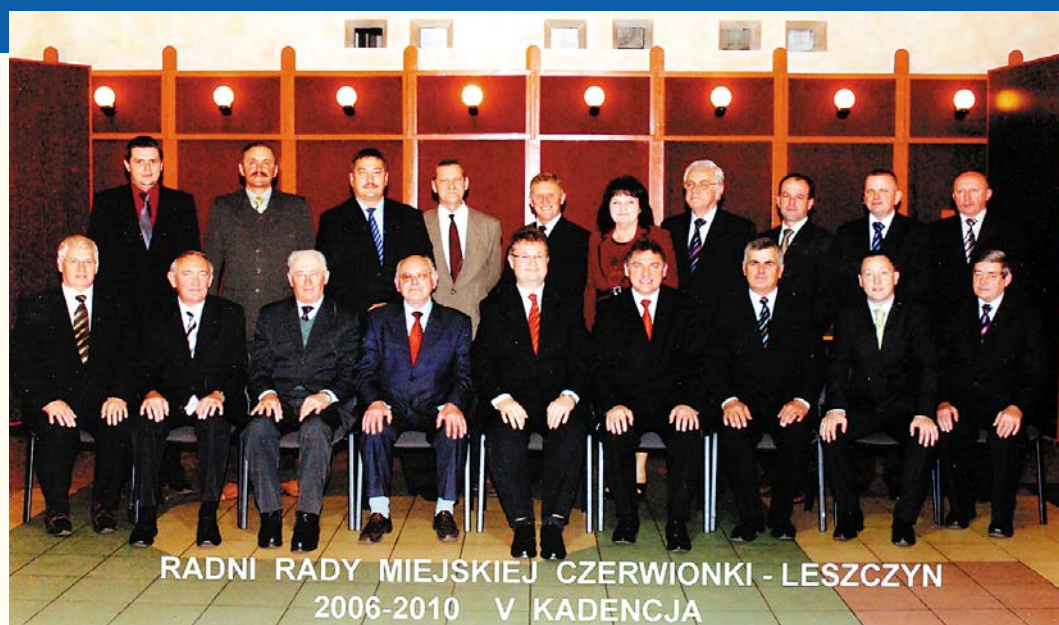
RADNI RADY MIEJSKIEJ CZERWIONKI - LESZCZYN 2006-2010 V KADENCJA