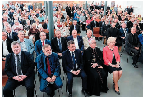
Uczestnicy uroczystości na Łaźni Łańcuskowej; foto: Marian Wójcik

węgla kamiennego oraz liczne wspólnoty wspólnie organizujące – właściciele, dyrekcje i zarządy kopalń węgla, duchowieństwo, górnicze związki zawodowe, stowarzyszenia, organizacje i samorządy miejscowości, gdzie są lub były kopalnie.