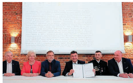
Minister Grzegorz Tobiszowski prezentuje podpisany wniosek; foto: Marian Wójcik

■ sztukach, widowiskowych i tradycjach muzycznych – np. tradycjach wokalnych, instrumentalnych i tanecznych, widowiskach religijnych, karnawałowych i dorocznych;