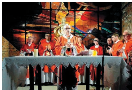
Msza św. na poziomie 170 m

21 kwietnia 2018 r. w zabytkowej Kopalni Guido w Zabrzu odbyła się uroczystość podpisania wniosku o wpisanie „Barbórki” na Listę Niematerialnego Dziedzictwa Kulturowego. Inicjatywa tego wniosku powstała w Muzeum Górnictwa w Zabrzu, ale szybko uzyskała poparcie ze strony władz państwowych i samorządowych, związków zawodowych, organizacji społecznych, kościoła katolickiego i ewangelickiego oraz licznych stowarzyszeń. We wniosku wskazano, że „Barbórka” na Górnym Śląsku świętują górnicy kopalni