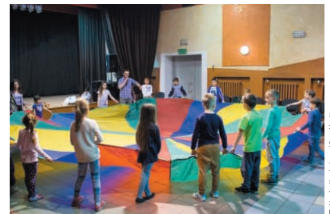
(6 zdjęć)