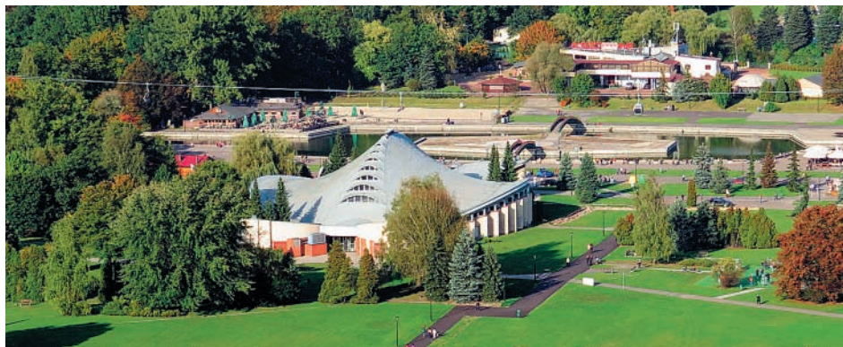
„Fragment Parku Śląskiego z widokiem na tzw. »Kapelusz«”. Park Śląski został utworzony w połowie XX wieku na zdewastowanych terenach przemysłowych: hałdach, odpadach pogórnich, biedaszybach, zapadliskach, bagnach i wysypiskach na terenie Chorzowa i Katowic.”

Przy realizacji inwestycji przedsiębiorca zakłada rozwiązania organizacyjno-techniczne spełniające warunki racjonalnego zagospodarowania złoża, przy skutecznym ograniczeniu i minimalizacji wpływu na poszczególne komponenty środowiska, a po jej zakończeniu rekultywację terenu oraz rozwiązania mające na celu zagospodarowanie pod rekreację dla miejscowej społeczności.